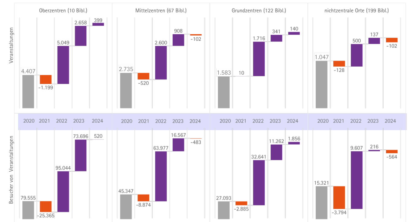
Abb. 4.4.2-2: Veranstaltungen und Veranstaltungsbesucher in Bibliotheken 2020 sowie Veränderungen zum Vorjahr bis 2024 nach Zentralörtlichkeit