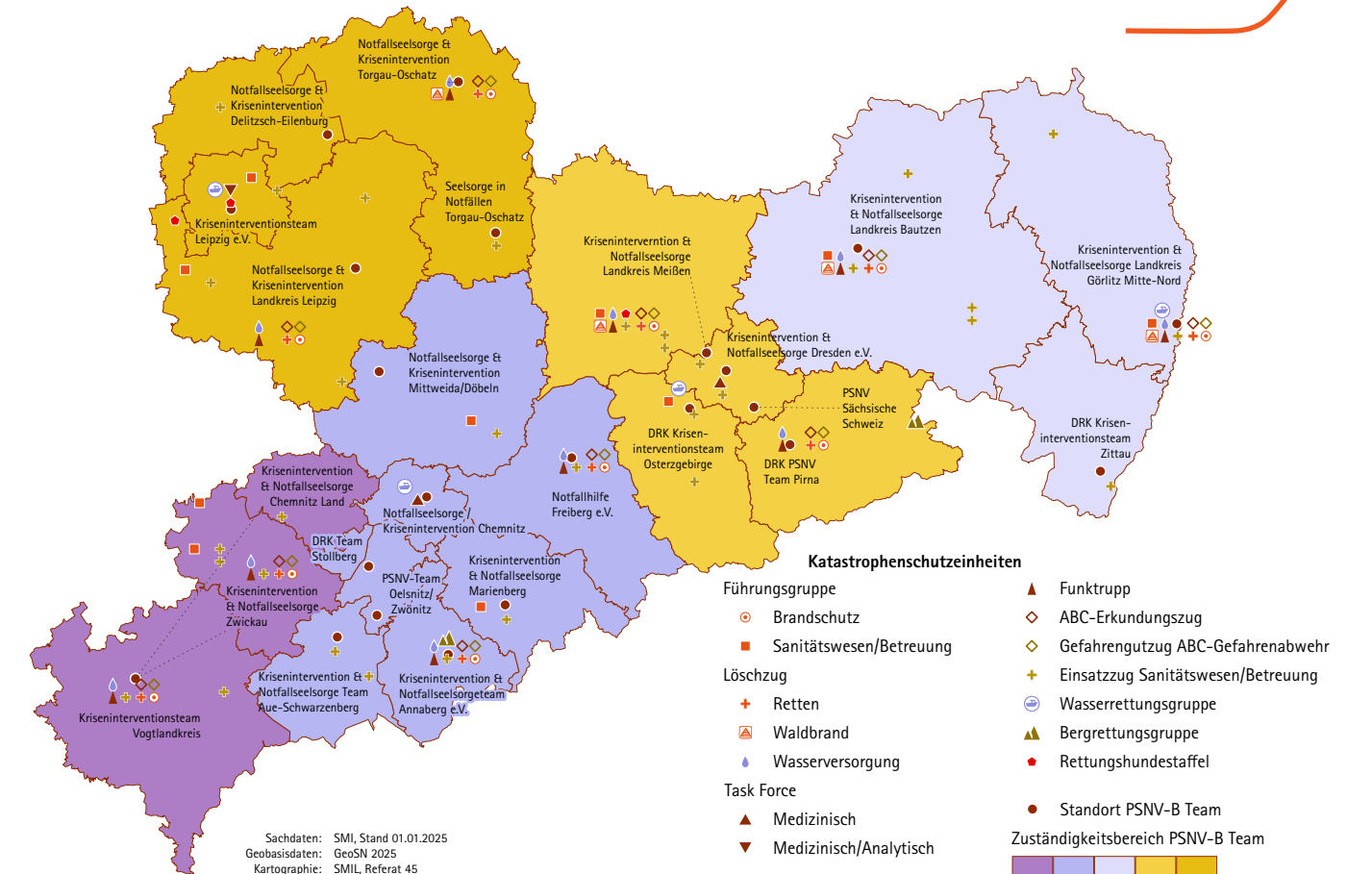
Abb. 4.5.3-2: Katastrophenschutz und Psychosoziale Notfallversorgung (PSNV)

Mit der Veröffentlichung der strategischen Waldbrandschutzkonzeption 2023 reagierte der Freistaat unmittelbar auf die Waldbrände des Sommers 2022 und optimierte die Zusammenarbeit der Einsatzkräfte im Bevölkerungsschutz. Durch bestehende Hilfeleistungsvereinbarungen mit Polen und Tschechien wird die grenzüberschreitende Katastrophenhilfe im gesamten sächsischen Grenzraum sichergestellt.