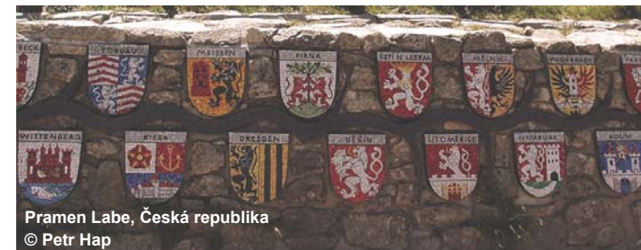
Pramen Labe, Česká republika